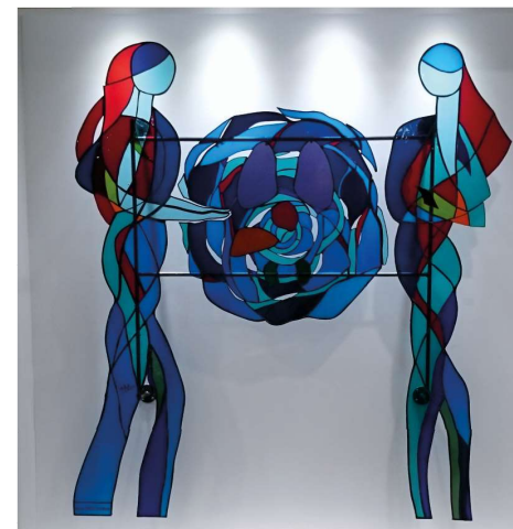
Mémorial des donneurs présenté dans le hall du Centre Hospitalier de Boulogne-sur-Mer